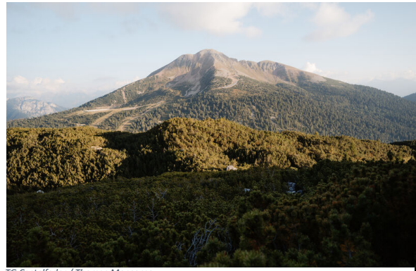
TG Castelfeder / Thomas Monsorno

Wir starten unsere Reise im Büro der Ferienregion Castelfeder. Von dort aus machen wir uns auf den Weg in Richtung Bozen zum Kreisverkehr. An diesem nehmen wir die erste Ausfahrt auf die bekannte Dolomitenstraße. Vorbei an Montan eröffnet sich uns ein reizvoller Blick auf den Unterlander-Talboden und westlich des langen Bergzugs vom Gantkofel über den Roen bis zur Brentagruppe. Weiter führt uns die Strecke vorbei an der kleinen Ortschaft Kaltenbrunn zum Sattel von San Lugano. Die Straße senkt sich nun in das Fleimstal hinab, und die ersten Gipfel der Lagorai-Kette, die das Tal begleiten, werden erkennbar. Bald erreichen wir auf sanft geneigter, sonniger Wiesenflur den Ort Cavalese. Von dort aus folgen wir der Straße in Richtung Lavazè, passieren zunächst kleine Dörfer und später grüne Tannenwälder auf dem Hochland. Vom Lavazèjoch aus geht es weiter zum nahegelegenen Jochgrimm, dem Sattel zwischen dem Weiß- und Schwarzhorn. Von dort aus bieten sich Wandertouren auf die beiden Hörner oder zu nahegelegenen Almbetrieben an. Vom Gipfel aus eröffnet sich uns ein wunderbarer Fernblick über die umliegende Bergwelt. Zurück geht es über das Lavazèjoch nach Birchabruck im Eggental und von dort über Bozen auf der Staatsstraße wieder nach Auer.